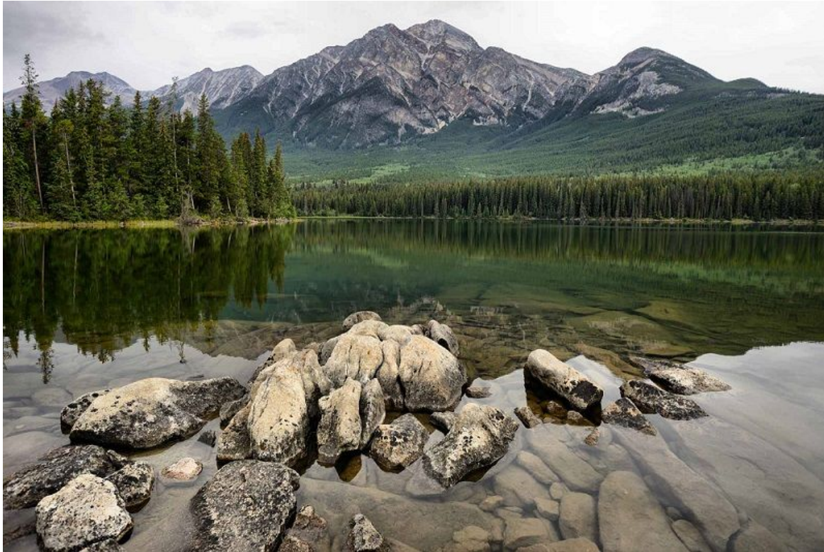
Enfant de la terre