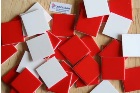
Ensemble de tuiles blanches et rouges