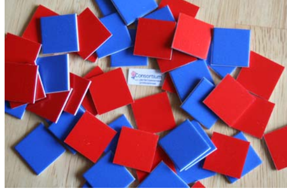
Ensemble de tuiles rouges et bleues