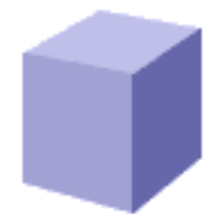
HEXAÈDRE ou CUBE ( 6 FACES )